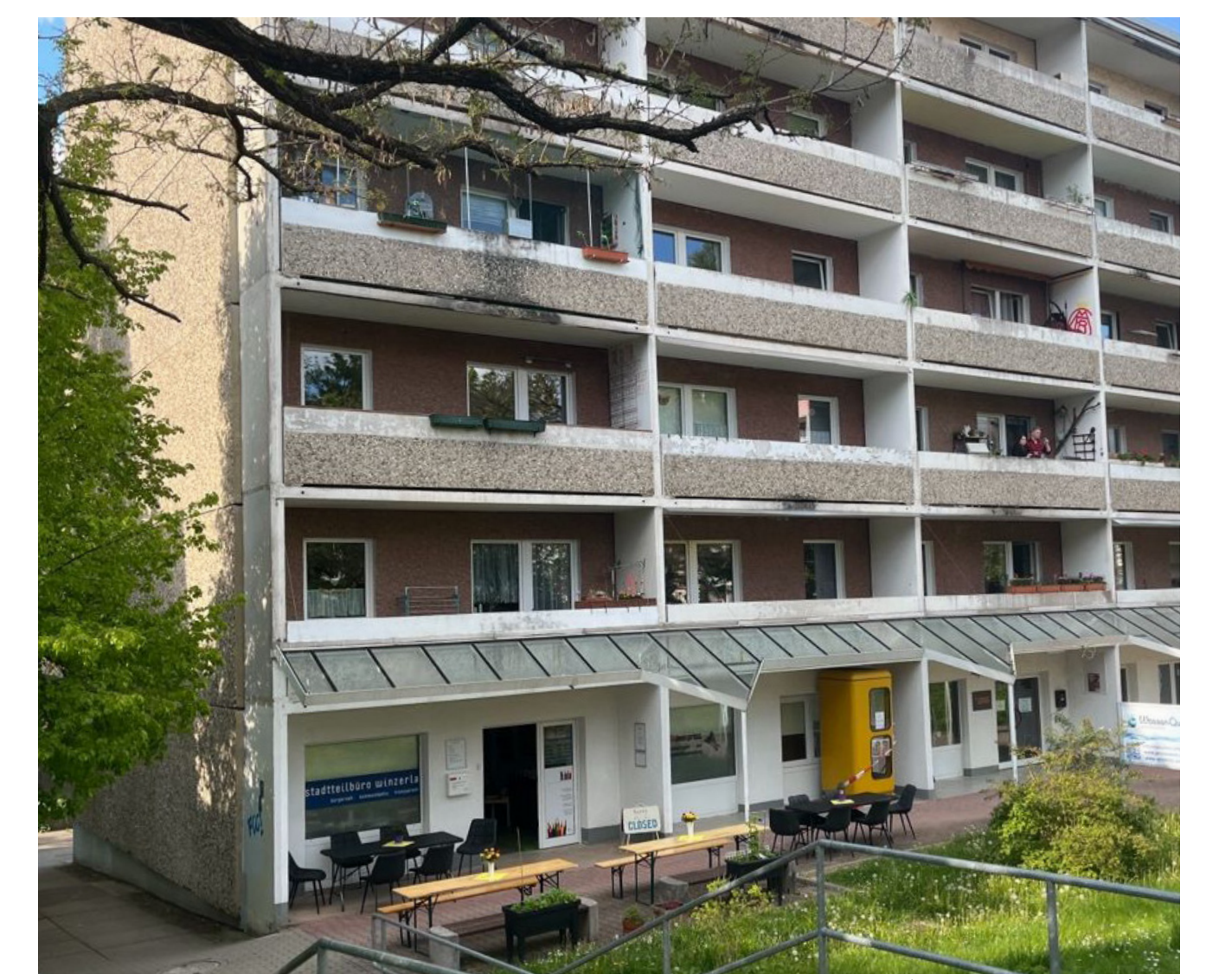
Abbildung 2: Stadteilbüro Jena Winterla

Wie wird das GWA-Konzept in der Praxis verstanden und umgesetzt? Wie verhält sich das zur Sozialraumorientierung? Wie findet Politikgestaltung statt und wie positionieren sich GWA-Arbeitende? (Schreier 2011, Abs. 9)